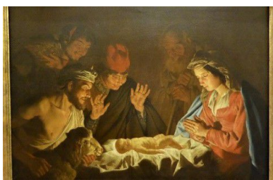
Weihnachten 16.Jh., Neapel.