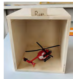
genaues Abmessen, Sägen, Schleifen, Kleben