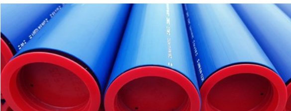
Wasserleitungsrohre, wie sie im Hammershaus eingesetzt werden