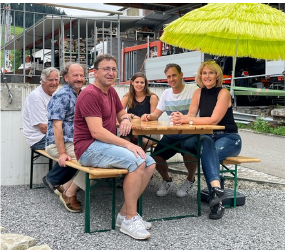
Die Jugendkommission auf dem neuen Aussensitzplatz

Nach den Sanierungsarbeiten der Räume für den Jugendtreff nach dem Wasserschaden im Sommer 2021 konnte auch ein langgehegter Wunsch des Jugendtreffs nach einem Aussensitzplatz erfüllt werden. Die BauWerkTeam GmbH hat die Arbeiten für die Erstellung des Platzes zu Gunsten der Jugendlichen nicht verrechnet. Die Gemeinde musste lediglich das Material bezahlen. Herzlichen Dank an die BauWerkTeam GmbH. Der Aussensitzplatz konnte am sehr gut besuchten Willkommensfest des Jugendtreffs am 17. August 2022 den Jugendlichen übergeben werden.