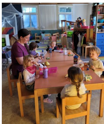
Lebhafter Betrieb der Villa Kunterbunt im Schuljahr 2021/22

Im vergangenen Schuljahr haben zwei initiativ Frauen aus Untereggen jeweils am Freitag einen Mittagstisch mit Tagesstruktur für Schulkinder aber auch für Vorschulkinder in den Räumen des Rest. Schäfle angeboten. Dieses Angebot wurde nun auf das Schuljahr 2022/2023 mangels Nachfrage und aufgrund von persönlichen Veränderungen eingestellt. Dennoch nimmt der Gemeinderat eine gewisse Nachfrage nach Tagesstrukturen insbesondere bei Neuzugezogenen wahr.